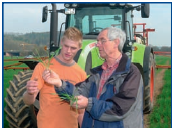
Anbau landw. Nutzpflanzen